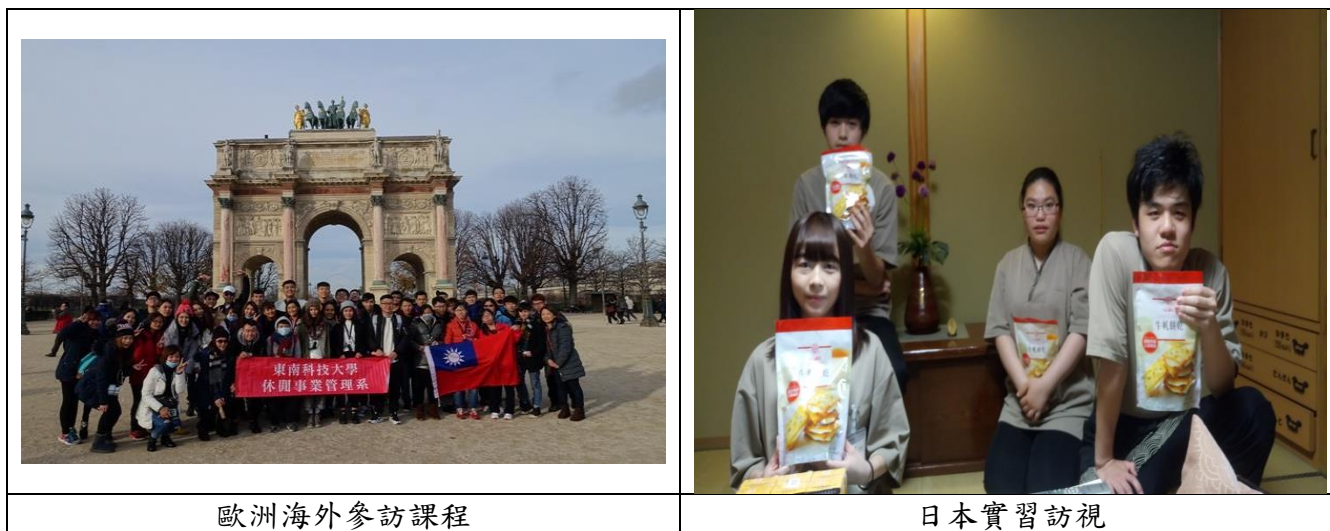
歐洲海外參訪課程