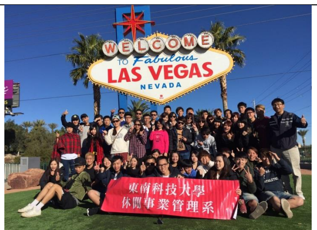
美國海外參訪課程