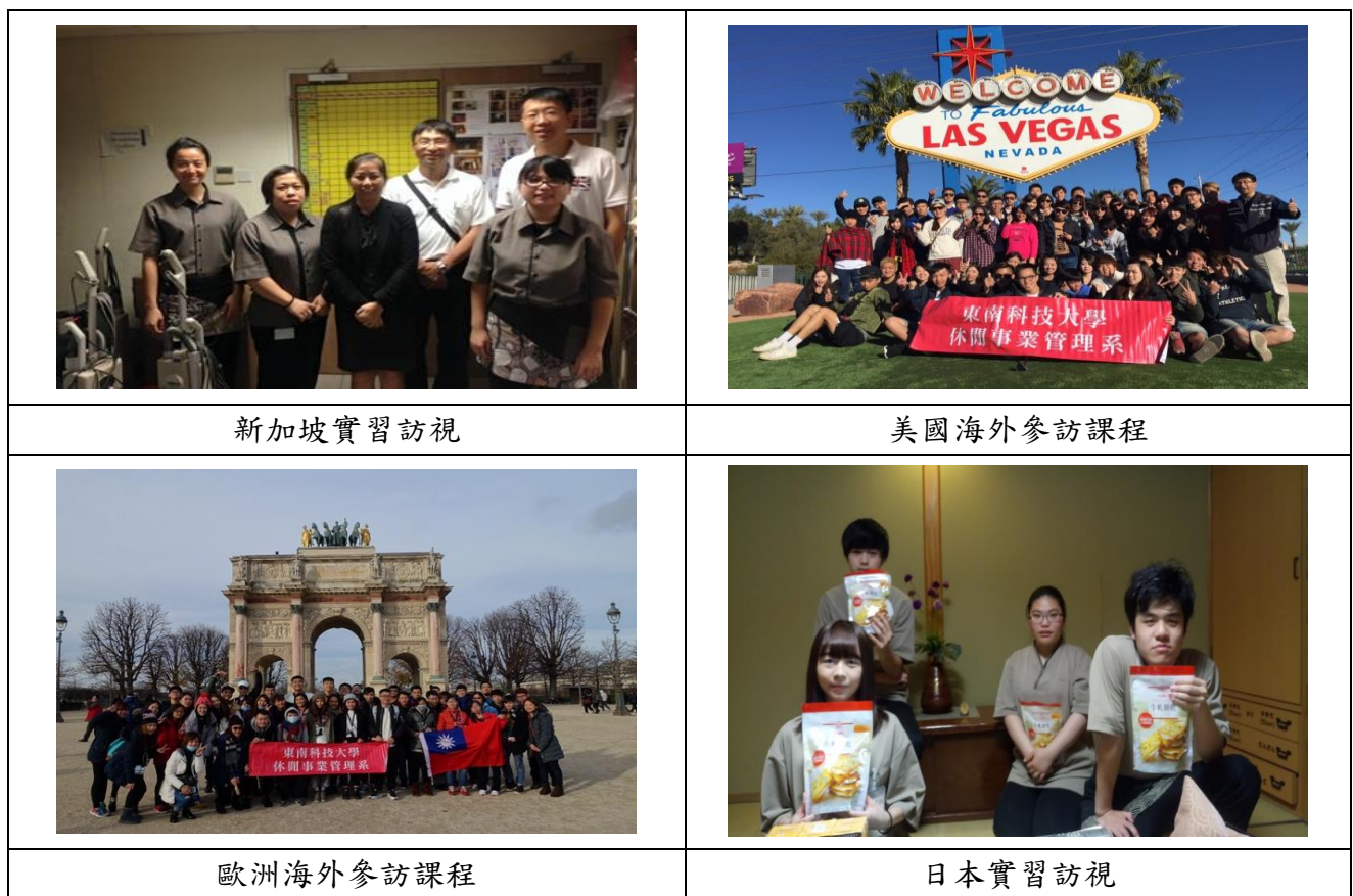
圖 2.2 學生校外實習與國際交流照片

在全球國際化競爭時代下，為了培育符合時代潮流且具有國際觀的優秀學生，符合本系教育目標培養具國際觀的人才，本系於 97 學年度開始校外實習，101 學年度開始送出學生前往海外實習，期許學生透過海外一年期的全時實習，增長國際觀及競爭力。同時，本系於設立時即期許培育具國際觀的學生，故於大四課程內即安排海外參訪實習課程為必修，但因顧慮學生家庭經濟狀況，於 102 學年改為選修課程。學生在海外實習及國外參訪的課程安排下，有機會參與國際事務的實際交流，學生獲益匪淺，如圖 2.2。學生交流、成長與學習之措施與執行成效如表 2.12，更完整檔案請見附件 2-29。